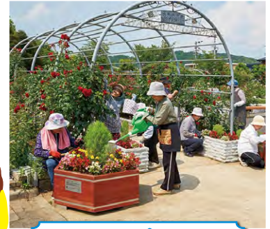
フラワープランター